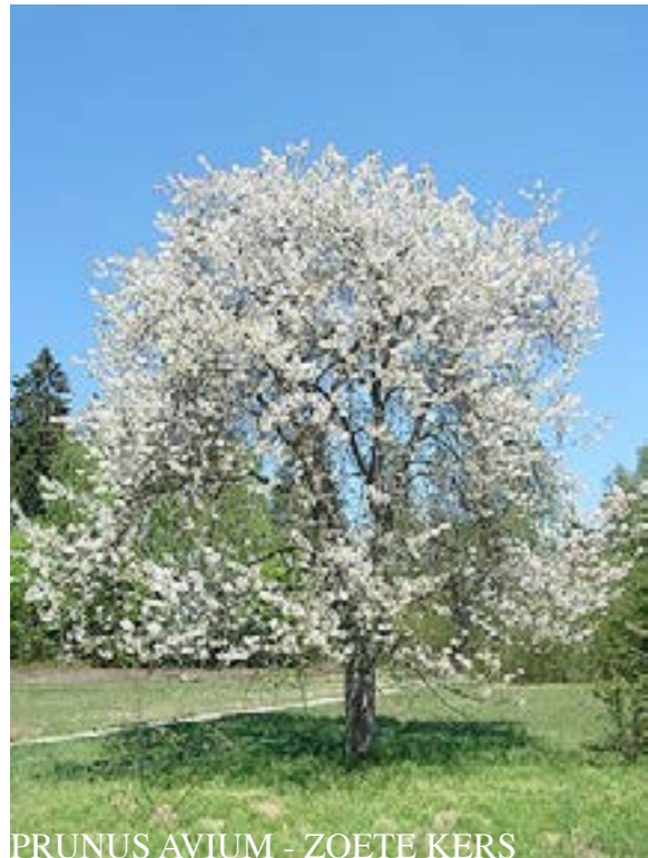
PRUNUS AVIUM - ZOETE KERS