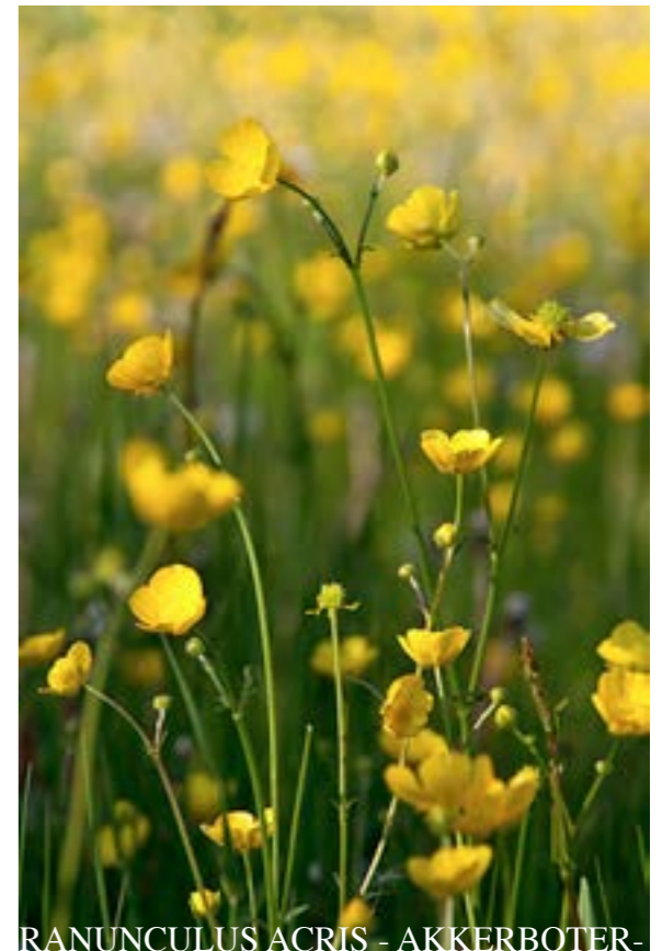
RANUNCULUS ACRIS - AKKERBOTER-