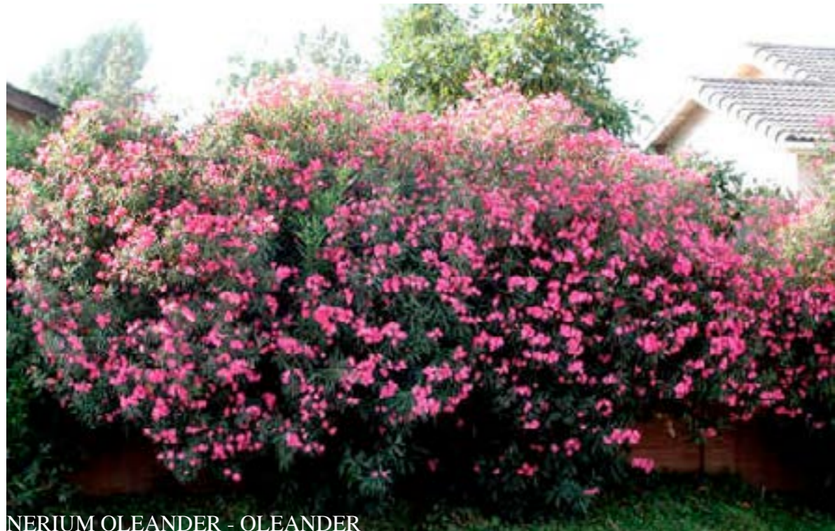
NERIUM OLEANDER - OLEANDER