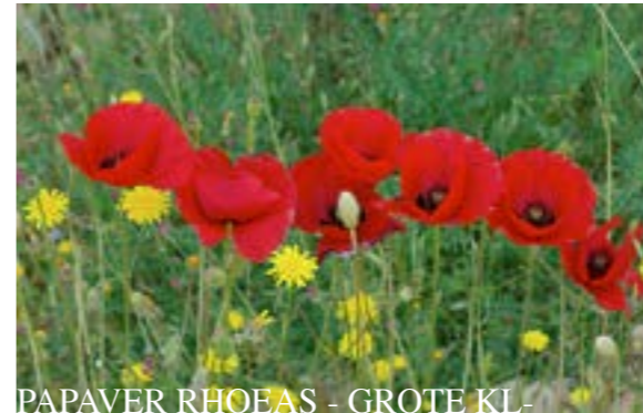
PAPAVR RHOEAS - GROTE KL-