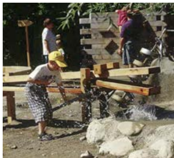
krokodil pomp, watertafels & glijbaan Richter Spielgeräte