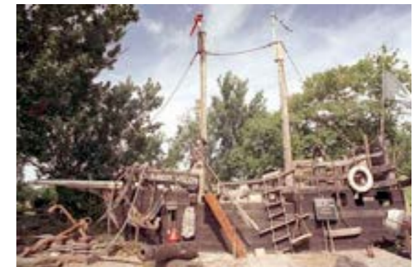
Wrakkenmuseum Terschelling, Ontwerper & Zeeheld Ole (dj)