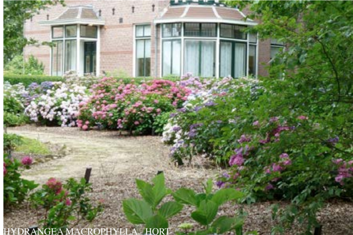
HYDRANGEA MACROPHYLLA - HORT-