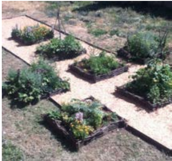
Moestuin Carcassonne