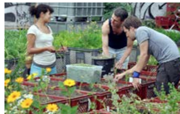
boven: Berlin links: London onder: Brooklin