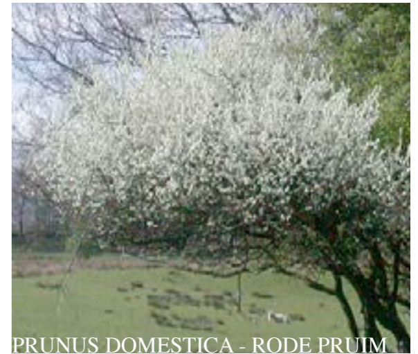
PRUNUS DOMESTICA - RODE PRUIM