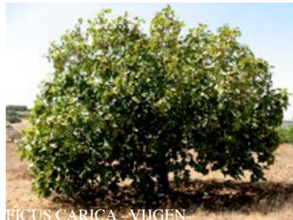
FICUS CARICA - VIIGEN-