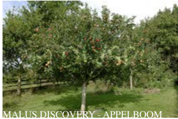
MALUS DISCOVERY - APPELBOOM